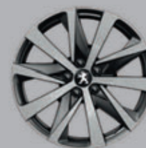
18" HIRONE two-tone