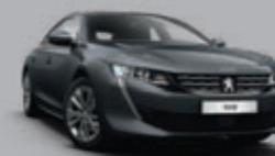
Gris Hurricane (1)