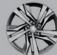
19" AUGUSTA two-tone