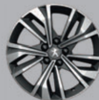
17" MERION two-tone