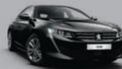
Noir Perla Nera