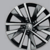
18" SPERONE two-tone