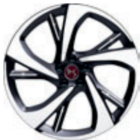
20" TOKYO (Performance line, Performance Line+)