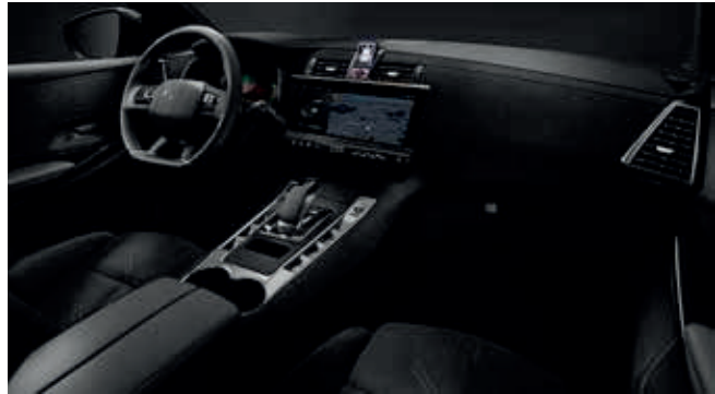
Black Alcantara® interieur