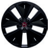
19" SILVERSTONE (Performance line, Performance Line+)