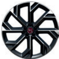
21" BROOKLYN lichtgrijs (Performance Line+)

● = Standaard ○ = Optioneel - = Niet leverbaar