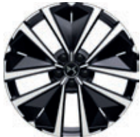
19" EDINBURGH (Bastille+, Rivoli, Opéra)