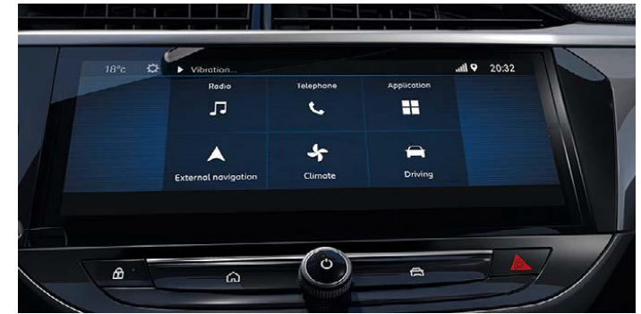
Multimedia systeem met 10" kleuren touchscreen