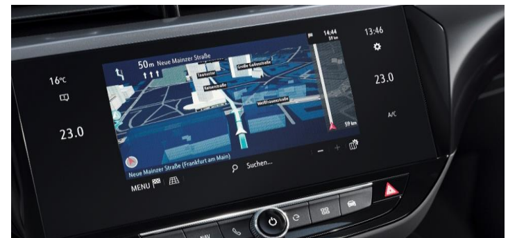
Multimedia Navi Pro met 10" kleuren touchscreen