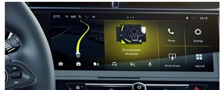
Multimedia Navi IVI met 10" kleuren touchscreen