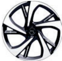
20" TOKYO (Bastille+, Rivoli, Opéra)