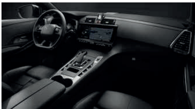
Black Basalt OPERA interieur

● = Standaard ○ = Optioneel - = Niet leverbaar