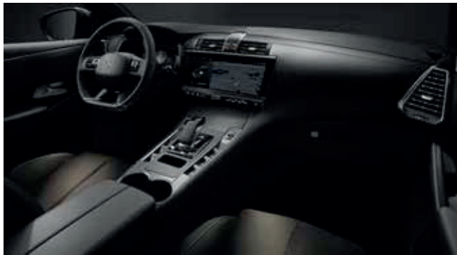
Interieur Perruzi Bronze