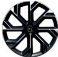
21" BROOKLYN lichtgrijs (Rivoli, Opéra)