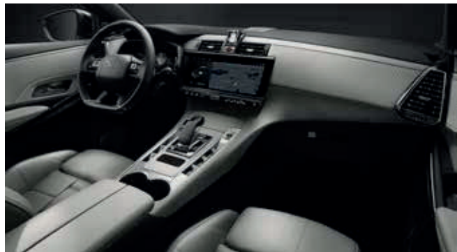
Paerl Grey OPERA interieur