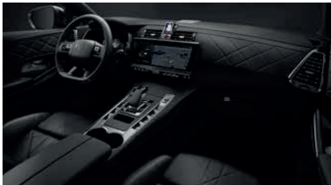
Basalt Black leder interieur