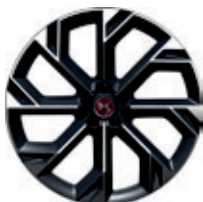
21" BROOKLYN lichtgrijs (Performance Line+)

● = Standaard ○ = Optioneel - = Niet leverbaar