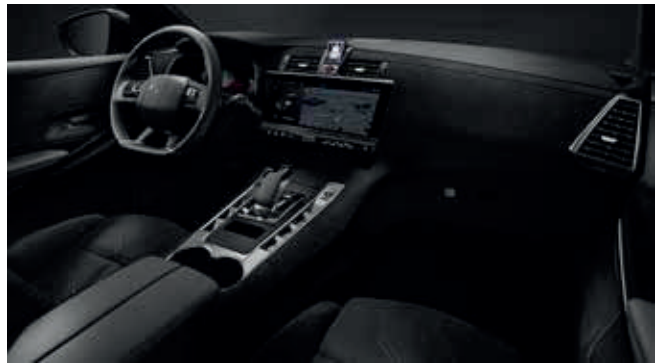
Black Alcantara® interieur