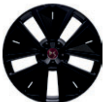
19" SILVERSTONE (Performance line, Performance Line+)