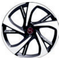
20" TOKYO (Performance line, Performance Line+)