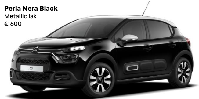
Perla Nera Black Metallic lak € 600